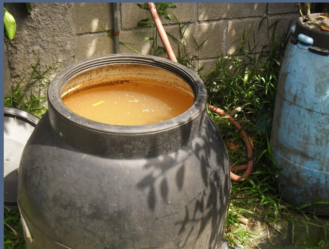
I ENCUENTRO DE COMISIONES DEL RECURSO HÍDRICO DE LA PROVINCIA DE CARTAGO