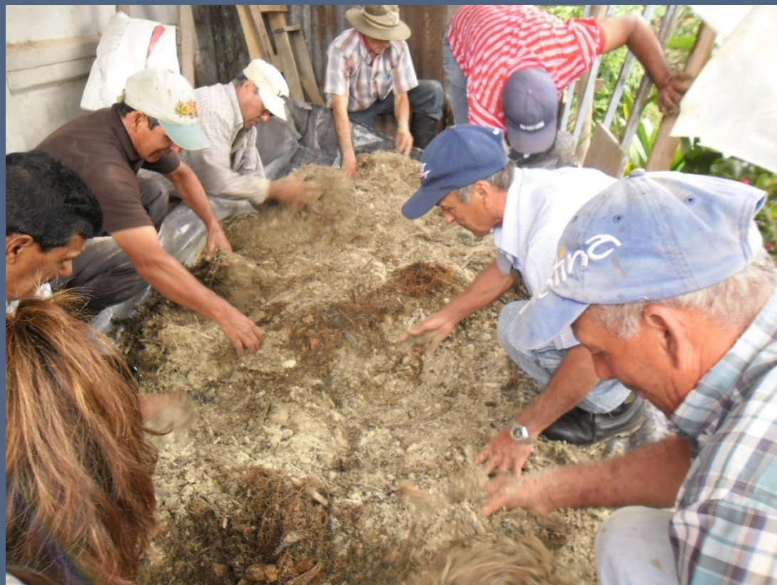
Elaboración bioinsumos Altos de Araya